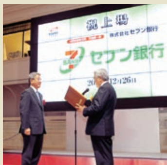
上場セレモニーの様子