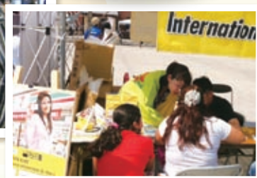
ペルーフェスティバル2011