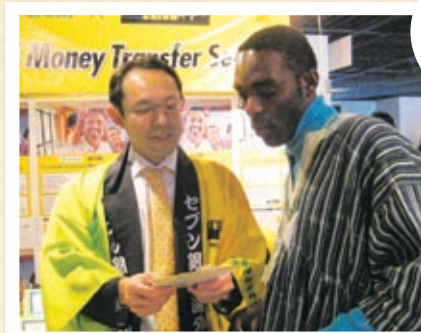
アフリカンフェスティバルよこはま2011

ために、外国人の方が多く集まるフェスティバルやコンサートなどで積極的に営業活動を行っています。セブン銀行は、こうしたイベントを、紹介の機会としてだけでなく、お客さまの声を直接お聞きする場と位置づけ、サービスの改善にも活かしています。