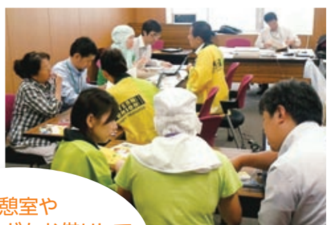
工場での営業の様子