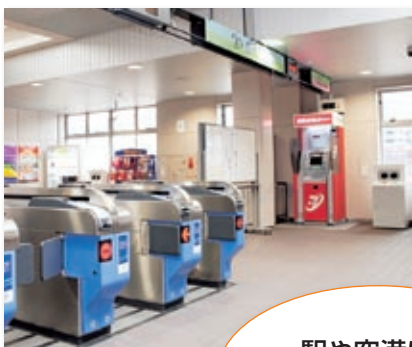
ゆりかもめ豊洲駅