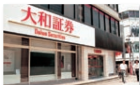
大和証券横浜西口支店