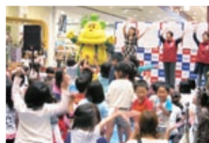
ボノロンキャッシュカード 発行記念イベント

『森の戦士 ボノロン』がデザインされた社会貢献型キャッシュカード「ボノロンキャッシュカード」(P12参照)を発行。また、10月からは、女性向けデザインの「Girl's Card」を発行。それぞれのカード発行に合わせて、イトーヨーカドーが運営するショッピングセンター「Ario(アリオ)」で記念イベントを行いました。なお、「ボノロンキャッシュカード」「Girl's Card」は、インターネットを用いた口座お申込時に選択することができます。