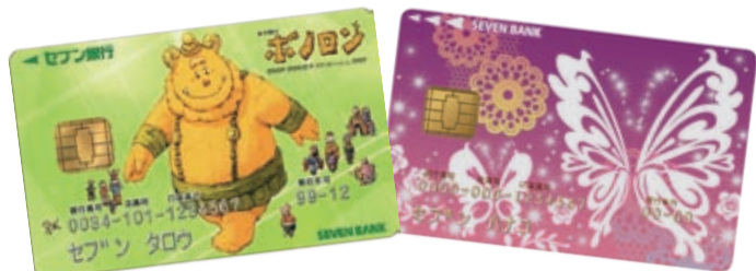
ボノロン キャッシュカード

セブン銀行は、より多くのお客さまに口座サービスをお使いいただき、ご満足いただけるよう、デザインカードの発行を開始しています。2011年7月には、セブン銀行が協賛する