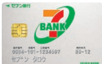
セブン銀行ロゴカード

『森の戦士 ボノロン』がデザインされた社会貢献型キャッシュカード「ボノロンキャッシュカード」(P12参照)を発行。また、10月からは、女性向けデザインの「Girl's Card」を発行。それぞれのカード発行に合わせて、イトーヨーカドーが運営するショッピングセンター「Ario(アリオ)」で記念イベントを行いました。なお、「ボノロンキャッシュカード」「Girl's Card」は、インターネットを用いた口座お申込時に選択することができます。