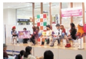
Girl's Card発行記念イベント