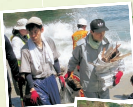
砂浜での清掃活動

※ 宮城県気仙沼市の三陸海岸の中ほど、岩手県陸前高田市との県境に位置する唐桑半島にあり、気仙沼湾の湾口に浮かぶ大島と向かい合っています。長さ230m、幅15mの小さな砂浜は、砂が乾いているときに踏むと「キュキュ」と鳴ることから「九九鳴き浜」と名付けられました。鳴砂は学術的にも貴重で国の天然記念物に指定されています。