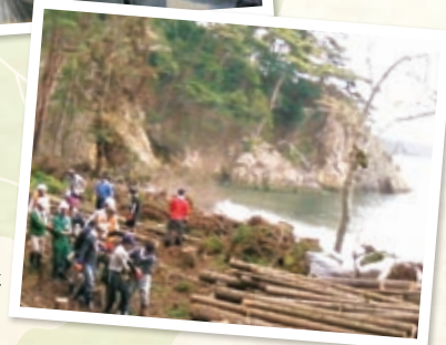
塩害を受けて伐採された杉の集積作業