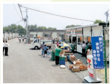
気仙沼公園仮設店舗