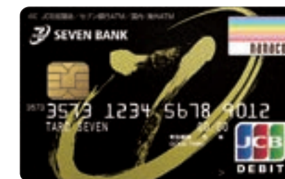
トラディショナル

ボノロン絵柄のカードは、1枚発行するごとにセブン銀行が100円を拠出し、全国の児童館に絵本を寄贈する、社会貢献型キャッシュカードとなっています。