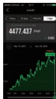
為替レートのチャート確認画面