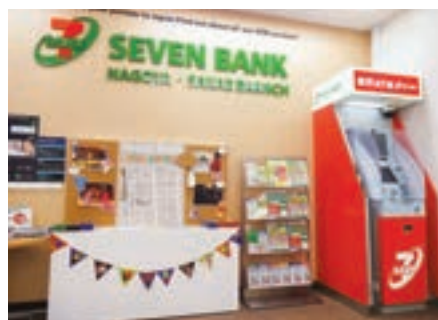
出張所における観光案内資料設置の様子

2016年9月、名古屋市との間で「多文化共生・観光推進での連携と協力に関する協定」を締結しました。本協定により、名古屋市に住む国内外のお客さま向けに、多言語での暮らしの情報や災害情報の配信を、海外送金サポートアプリを通して行っています。また、海外からの観光客向けに、セブン銀行名古屋・栄出張所において周辺の観光案内マップおよびパンフレットを設置しています。