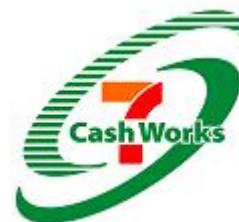
新会社ロゴマーク