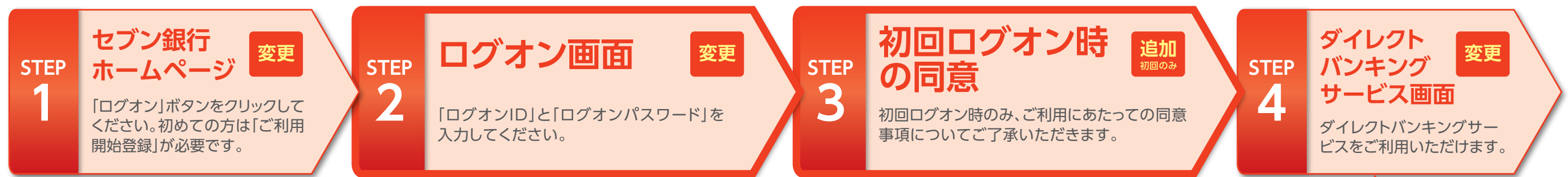
■新ログイン画面(以下が正しい画面です。)