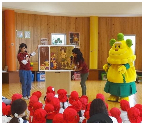
贈呈式終了後に行った読み聞かせの様子

セブン銀行は社会貢献活動の一環として、2005年6月より親子のコミュニケーションを応援するための読み聞かせ絵本「森の戦士ポノロン」の発行・無料配布に協賛・協力をしています。