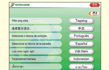
9言語に対応したATM取引画面