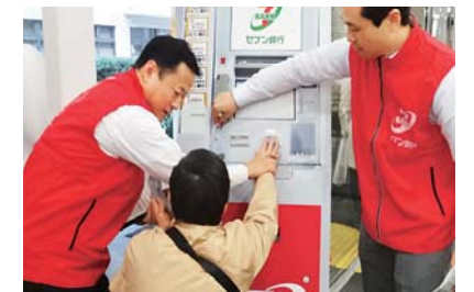
音声ガイダンスサービス体験

※ 日本点字図書館オープンオフィス：日本点字図書館が行っている視覚障がいのある方向けの取組みを、ワークショップなどを通じて紹介するための施設公開イベント。