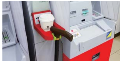
杖／ドリンクホルダー

セブン-イレブン店内のATMに「杖／ドリンクホルダー」を設置しています。ATMでのお取引中に、杖や傘、コーヒーカップなどを置く場所を設けることで、お客様の利便性を高めています。