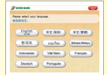
12言語から選択可能

セブン銀行ATMは、海外で発行されたキャッシュカードやクレジットカードに対応しています。海外からのお客さまがATMをスムーズにご利用いただけるよう、画面表示、明細票などは12言語に対応。操作に迷って一定時間が経過すると、英語オペレーターが24時間対応するコールセンターを音声でご案内するなど、サポート機能を充実させています。