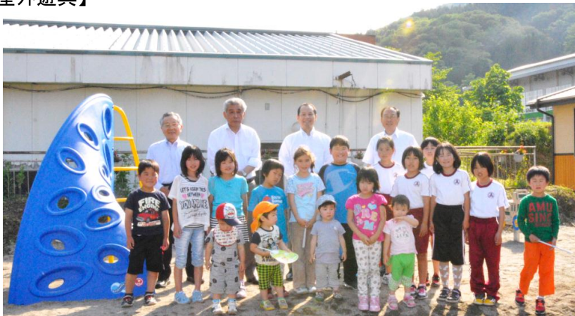
【完成した屋外遊具】