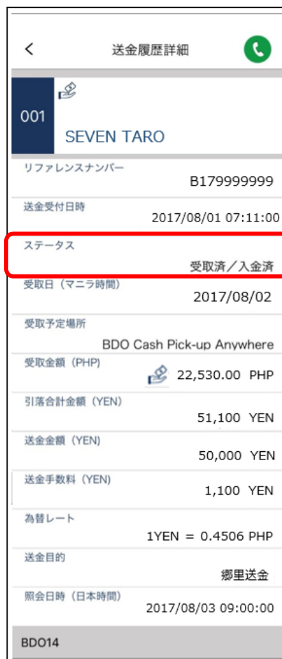
赤枠部分：送金資金の受取有無が確認可能