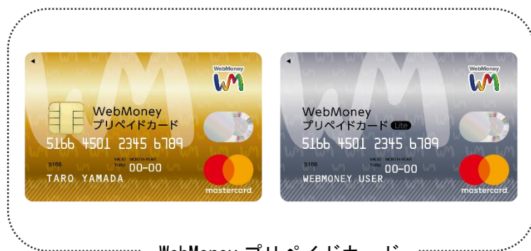
WebMoney プリペイドカード