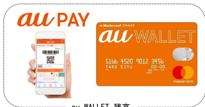
au WALLEt 残高