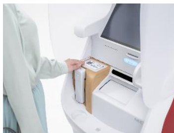
ATMによる本人確認書類の読み取り